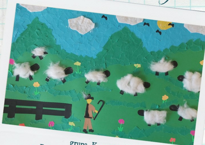
grupa Krasnale z Przedszkola Specjalnego w Czeladzi