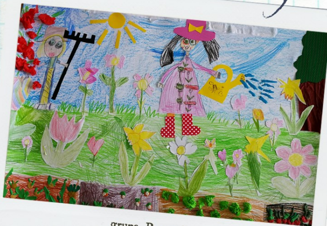
grupa Pszczółki z Przedszkola Miejskiego numer 1 w Będzinie