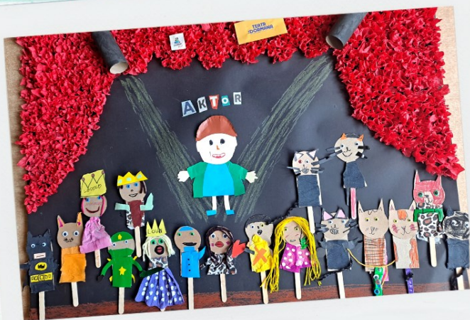
grupa Mistrzowie z Przedszkola Miejskiego numer 9 w Będzinie